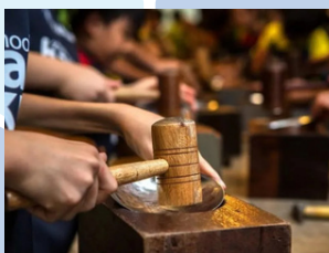
Royal Selangor Pewter