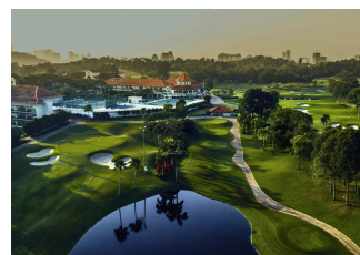
クアラルンプールゴルフ&カントリークラブ (KLGCC)

第13回アジア太平洋一般亜鉛メッキ会議 (APGGC) は、2025年6月23日に名門クアラルンプールゴルフ&カントリークラブ (KLGCC) でゴルフ大会を開催します。ティーオフ時間は午前7時です。ゴルフ愛好者は、地域で比類のない受賞歴のあるコースでプレーし、忘れられない思い出を作ることができます。